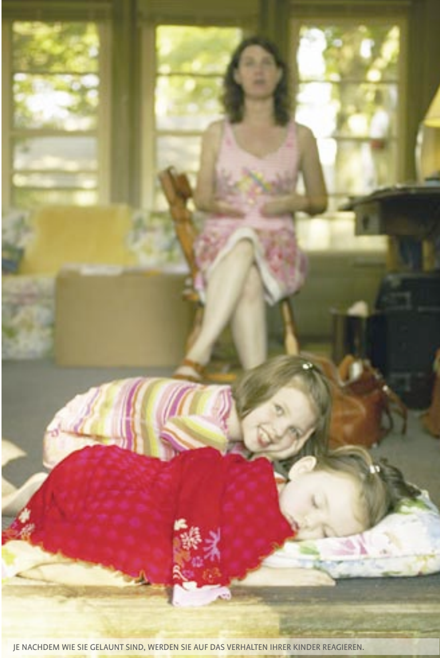
JE NACHDEM WIE SIE GELAUNT SIND, WERDEN SIE AUF DAS VERHALTEN IHRER KINDER REAGIEREN.

Sicher ist es wichtig zu wissen: „Wie reagiere ich auf ein Verhalten, das mich ärgert und trotz allem eine positive Absicht verfolgt, adäquat?“