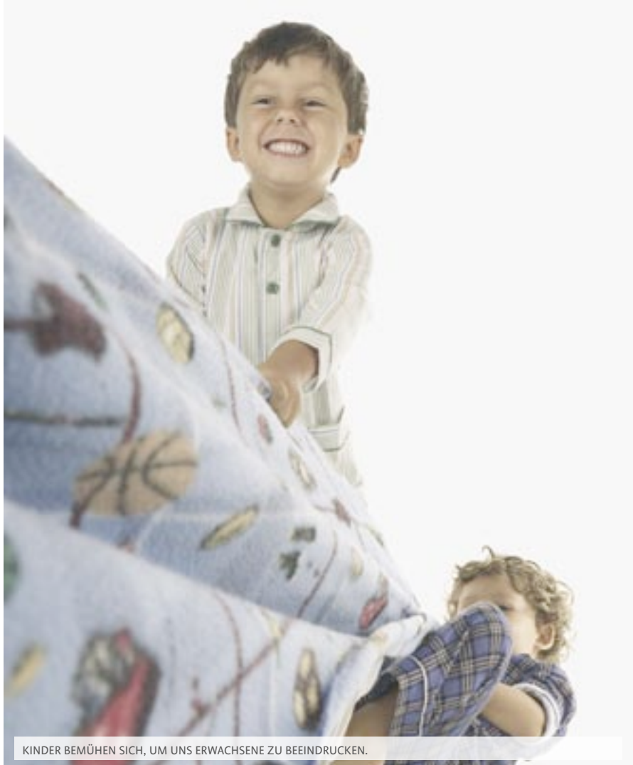
KINDER BEMÜHEN SICH, UM UNS ERWACHSENE ZU BEEINDRUCKEN.