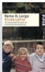
Kinderjahre von Remo H. Largo Verlag: PIPER ISBN 3-492-23218-3